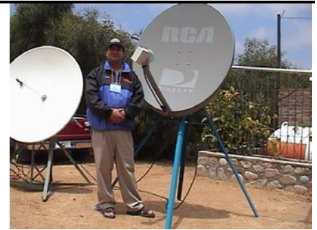
XQ3SA y las antenas satelitales

En ella tuvieron destacada participación con interesantes charlas nuestros socios Italo, CE3LD y Axel, CE3AFC y exposición de equipos para transmisión satelital de Guillermo, XQ3SA y Axel, CE3AFC.