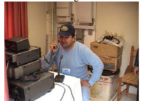
Transmisión del boletín desde Algarrobo

24 de Noviembre Transmisión del boletín de Federachi por CE3BSQ según calendario, desde “Las Brisas de Algarrobo”.