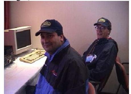
XQ3SA y CE3AFC