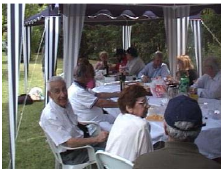
¡Esto está muy bueno!