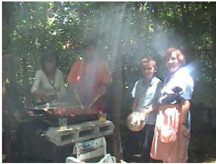
¡Preparando los choripanes!